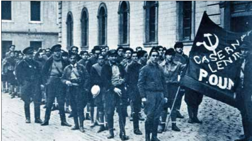
En esta instantánea de 1937 vemos a milicianos del POUM preparados para incorporarse al frente de guerra. En la última fila, con la cabeza destacando sobre los demás, George Orwell.

A poco de llegar a Barcelona se alistó en las milicias del POUM, un partido de ideología anarquista y trotskista que deseaba simultanear la guerra contra el fascismo con la revolución social. Tras apenas una semana de formación militar, fue destinado al frente de Aragón. Aunque aquel frente de batalla estaba por entonces poco activo, el 10 de mayo de 1937 Orwell recibió un balazo en el cuello que lo obligó a regresar a la capital catalana para recuperarse de la herida. Y cuando a mediados de junio el escritor se disponía a regresar al combate, el Gobierno republicano, muy influido y apoyado militarmente por la Unión Soviética regida por Stalin, acusó al POUM de haberse aliado con los fascistas, lo declaró ilegal y comenzó a detener y encarcelar a los principales