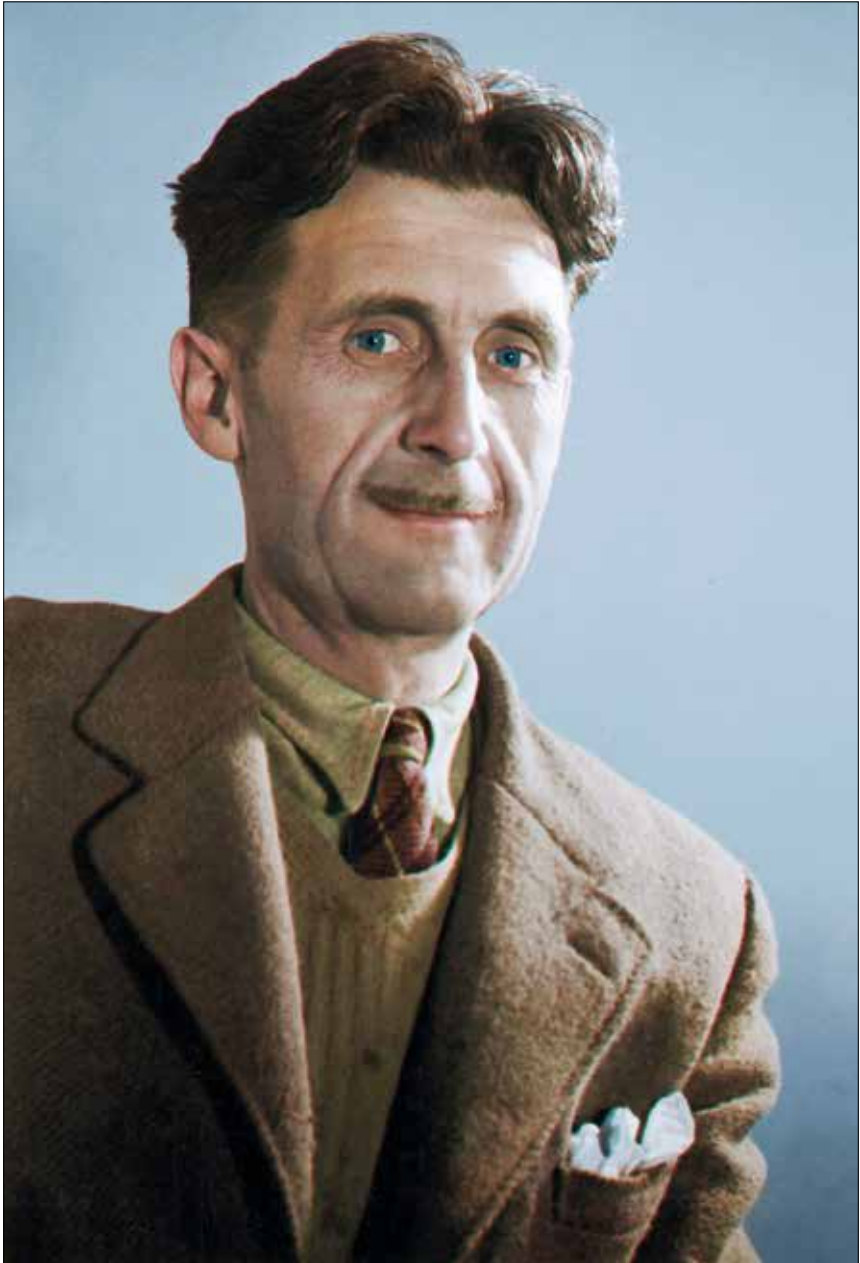
GEORGE ORWELL (1903-1950)