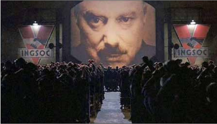
Fotograma de la versión cinematográfica de «1984», dirigida en 1984 por Michael Radford e interpretada por John Hurt (en el papel de Smith) y Richard Burton (en el de O'Brien). Con el emblema del Partido Único, el Ingsoc, al fondo, las masas jalean al Gran Hermano.

jo que Eileen y el escritor habían adoptado hacía apenas ocho meses. Al mismo tiempo, su salud comenzó a deteriorarse. Desde temprana edad, Orwell había padecido una enfermedad pulmonar, y la decisión de escribir su siguiente novela en Jura, una isla gélida y lluviosa situada al oeste de Escocia, no hizo más que agravar su dolencia. El autor británico tardó casi dos años y medio en componer 1984 , y durante ese tiempo estuvo enfermo y fue hospitalizado en diversas ocasiones, hasta que al fin falleció de tuberculosis el 21 de enero de 1950 en un hospital londinense.