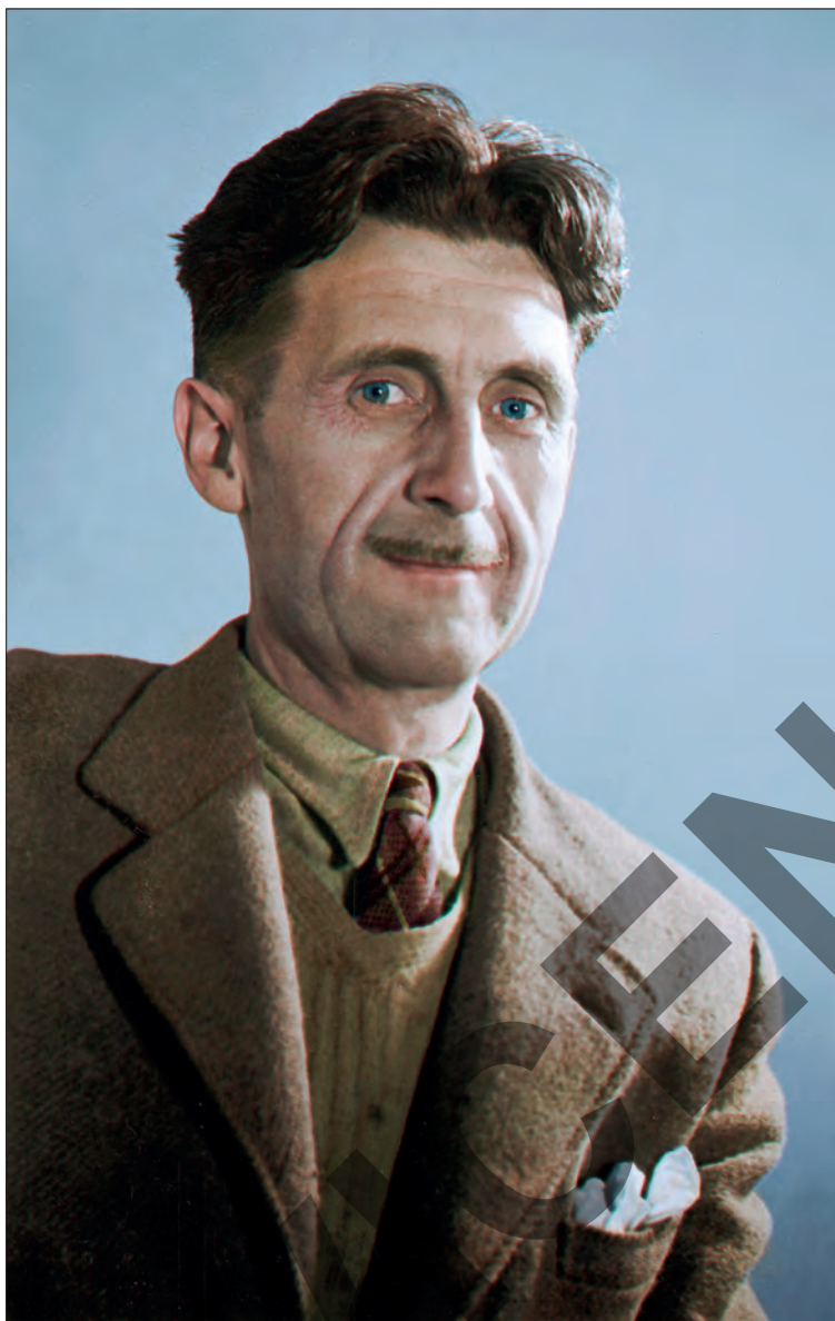
GEORGE ORWELL (1903-1950)