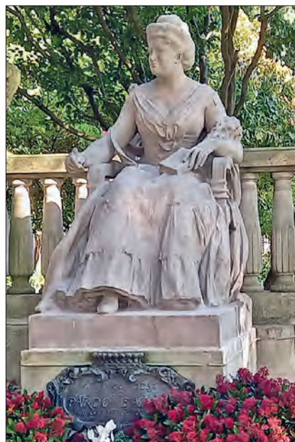
A la izquierda, retrato de Benito Pérez Galdós fechado en 1890, época durante la cual el escritor mantuvo una relación sentimental con Emilia Pardo Bazán. A la derecha, escultura en arenisca de Emilia Pardo Bazán, realizada por Lorenzo Coullaut Valera, situada en los Jardines Méndez Núñez de la ciudad de Coruña.

«Era preciso leer a los autores en su idioma, me consagré a aprender el alemán con objeto de sepultarme en la lectura de Hegel. Así que empecé a saberlo, faltóme tiempo para dedicarme a la de Schiller, Goethe, Heine, Bürger».