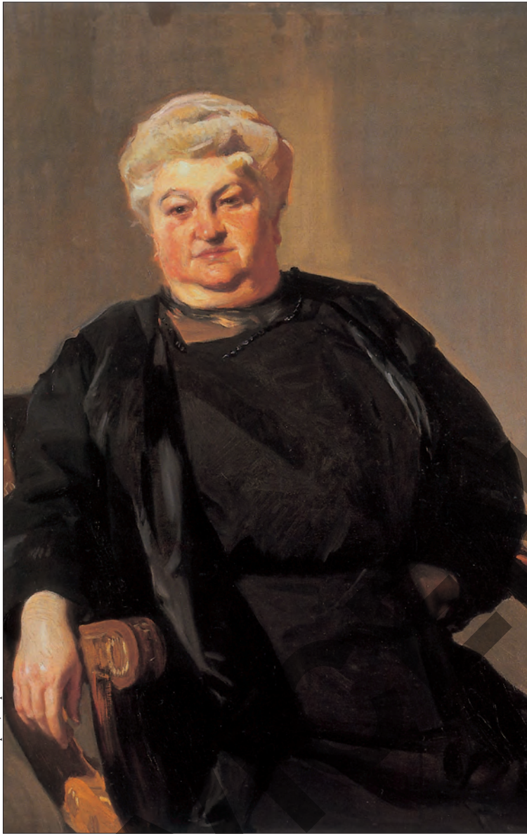
EMILIA PARDO BAZÁN (1851-1921)