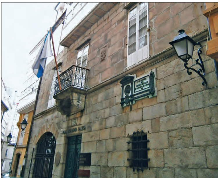
Casa noble del siglo XVIII situada en la calle Tabernas de La Coruña, donde Emilia Pardo Bazán vivió y compuso varias de sus obras. Hoy acoge la Casa-Museo de la autora y es la sede de la Real Academia Gallega.

[en una silla] y sin hacer diabluras horas enteras; de esas niñas que tienen a veces los ojos cansados y el nervio óptico débil, por haber pasado la tarde con la cabeza baja tragándose un librote. Los que me habían entregado, no me contentaba con leerlos una vez ni dos; si acertaban a gustarme, me aprendía trozos enteros de memoria, con esa fresca memoria de cera de la edad infantil; del Quijote sabía capítulos enteros».