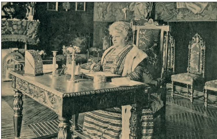
Postal que muestra a la condesa de Pardo Bazán escribiendo, conservada en el Archivo da Real Academia Galega.

En definitiva, Emilia Pardo Bazán reinterpretó el determinismo de Zola desde una óptica cristiana que, aunque reconoce el peso de la naturaleza, considera que sus leyes se pueden superar con la fuerza del espíritu y la voluntad. Su profundo catolicismo no podía negar el libre albedrío.