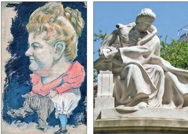
A la izquierda, caricatura anónima que muestra a Emilia Pardo Bazán poniéndose unos pantalones (ca.1895). Se conserva en el Museo del Pueblo de Asturias y pertenece al fondo documental de Patricio Adúriz. A la derecha, monumento a Emilia Pardo Bazán situado en la calle Princesa de Madrid, obra del escultor Rafael Vela del Castillo.

hombre y la mujer , donde defendió el derecho de las mujeres a recibir una educación íntegra y a ejercer una profesión en igualdad de condiciones.