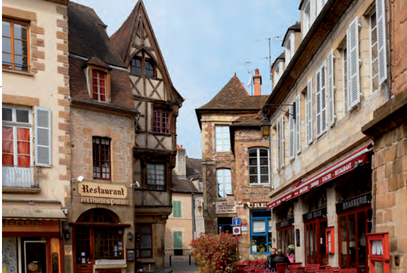
Place de l'Hôtel de Ville de Moulins.