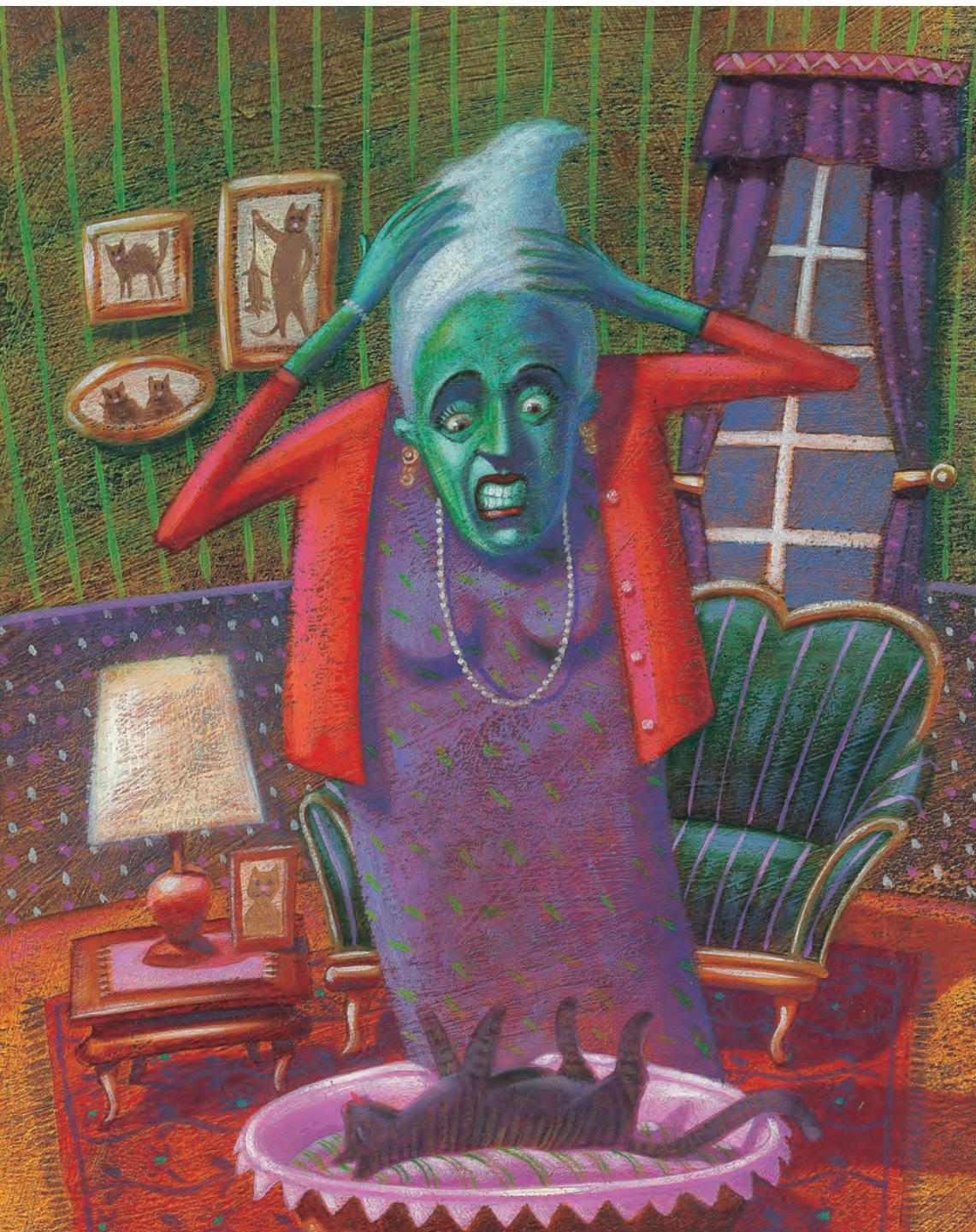
Vicens Vives - Du lait au fiel (Chat Noir. Lire et s'entraîner) - ISBN: 9788853001429