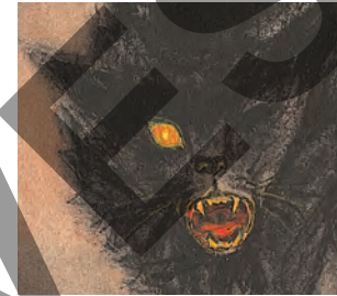
El gato negro

N o pido ni espero que crean el suceso, atroz como ninguno, aunque al tiempo tan doméstico, que voy ahora a relatar. Loco estaría yo, ciertamente, si lo esperara, cuando hasta mis propios sentidos rechazan lo que perciben. Loco no estoy, sin embargo, y desde luego no estoy soñando. Pero mañana voy a morir, y quisiera descargar hoy mi conciencia. Lo que me propongo es exponer sin más ante el mundo, con toda sencillez, sucintamente 1 y sin comentarios, una serie de hechos meramente familiares. Son sus consecuencias las que me han aterrorizado, torturado, destruido. Intentaré, no obstante, detallarlos. A mí solo me han aportado terror: a más de uno le parecerán más curiosos que terribles. Es posible, quizá, que con el tiempo algún intelectual dé una explicación trivial a mis fantasmas: alguien con una mente más tranquila, más lógica y mucho menos excitable que la mía,